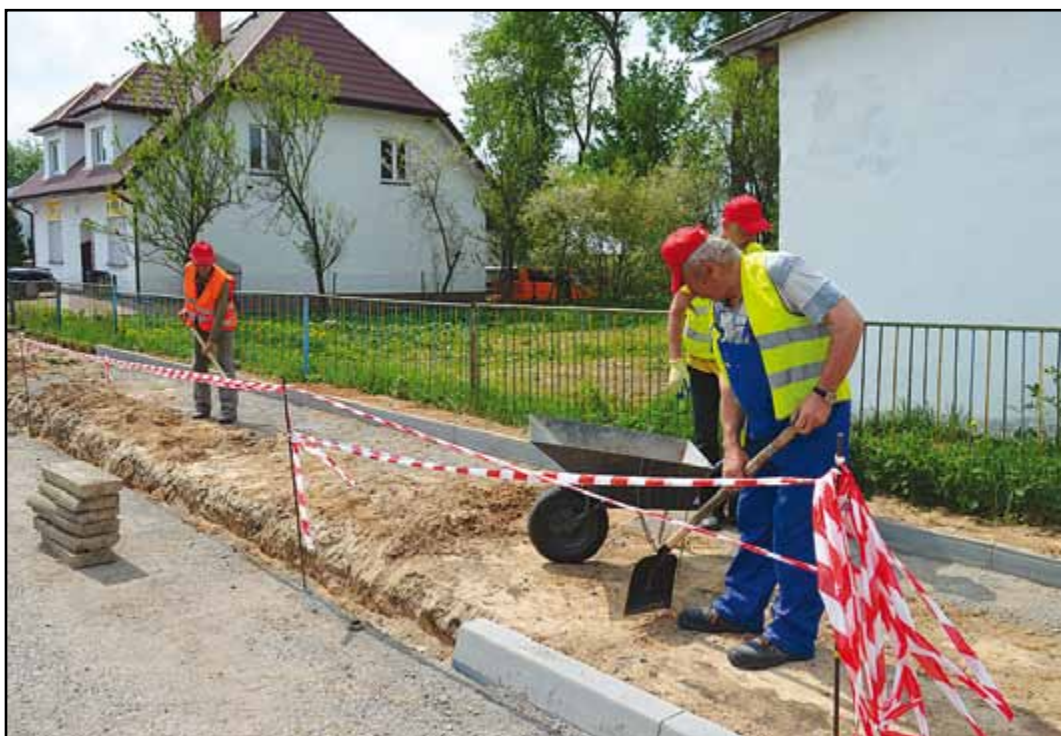
Szkolenie „Brukarz” w Krasnopolu ul. 22 Lipca.

Wymierną korzyścią obu szkoleń oprócz nabycia nowych umiejętności zawodowych przez osoby bezrobotne jest położenie nowych chodników zarówno w Sejnach