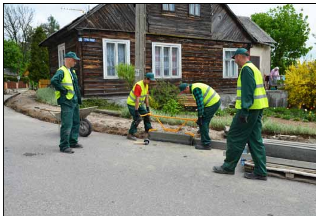
Szkolenie „Brukarz” w Sejnach, ul. Słowackiego

jak i w Krasnopolu. Dzięki uczestnikom szkoleń nową nawierzchnię zyskały: chodnik przy ulicy Słowackiego w Sejnach i chodnik przy ulicy 22 Lipca w Krasnopolu.